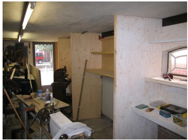
Hier al een idee hoe het wordt